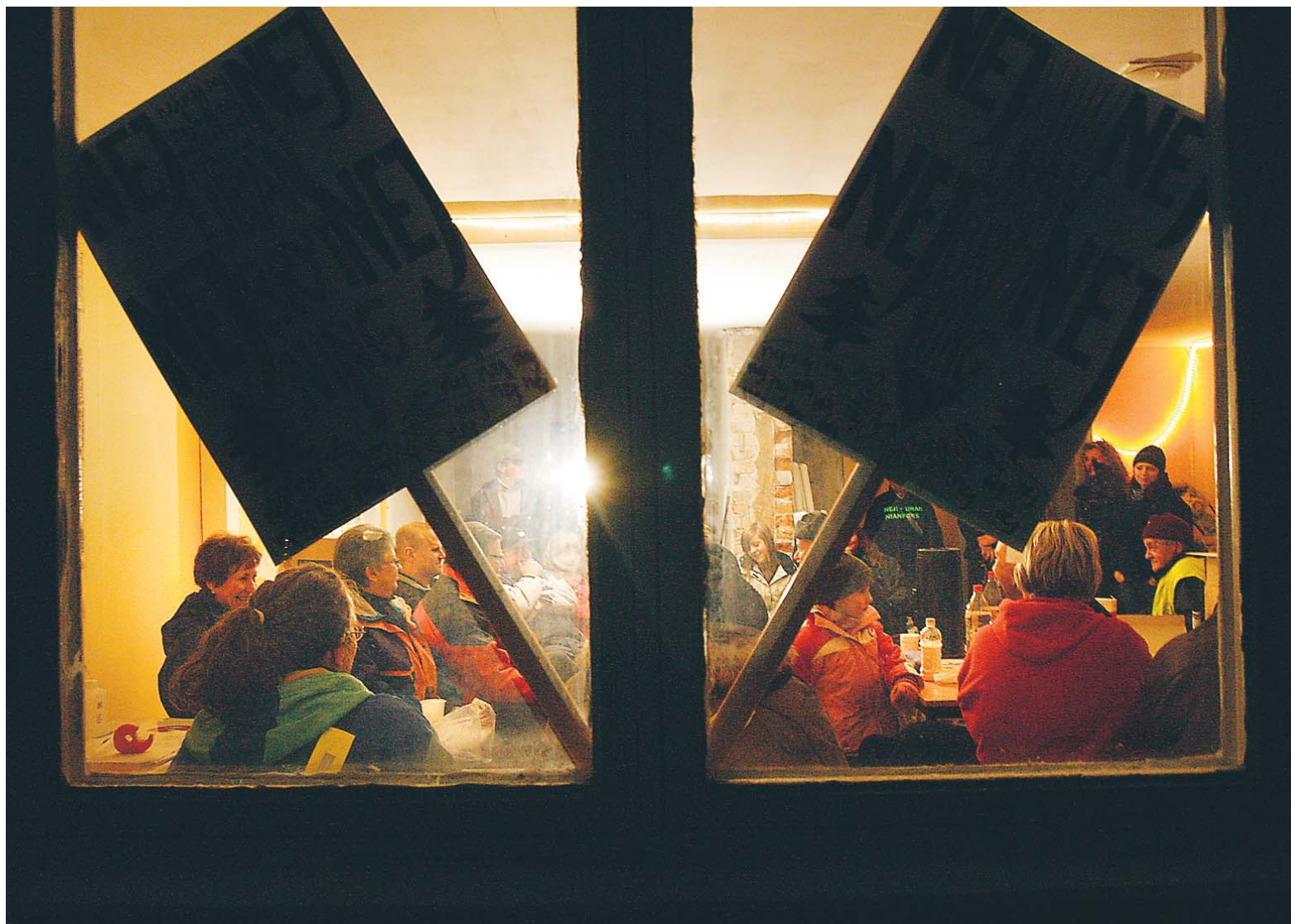
Nianforsborna är beredda att vakta vid Majsaberget igen.

■ En äldre man som skulle tvätta bilen i Norrköping på söndagskvällen tryckte av misstag på gasen medan han väntade på sin tur. I full karri åkte han rakt genom inkörsporten och vidare in i tvätthallen. Med sig han tre andra bilar. Alla bilarna skadades och fick bärgas från platsen.