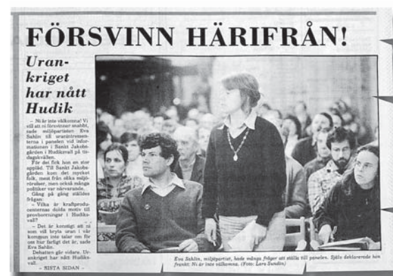
HT 12 januari 1983.