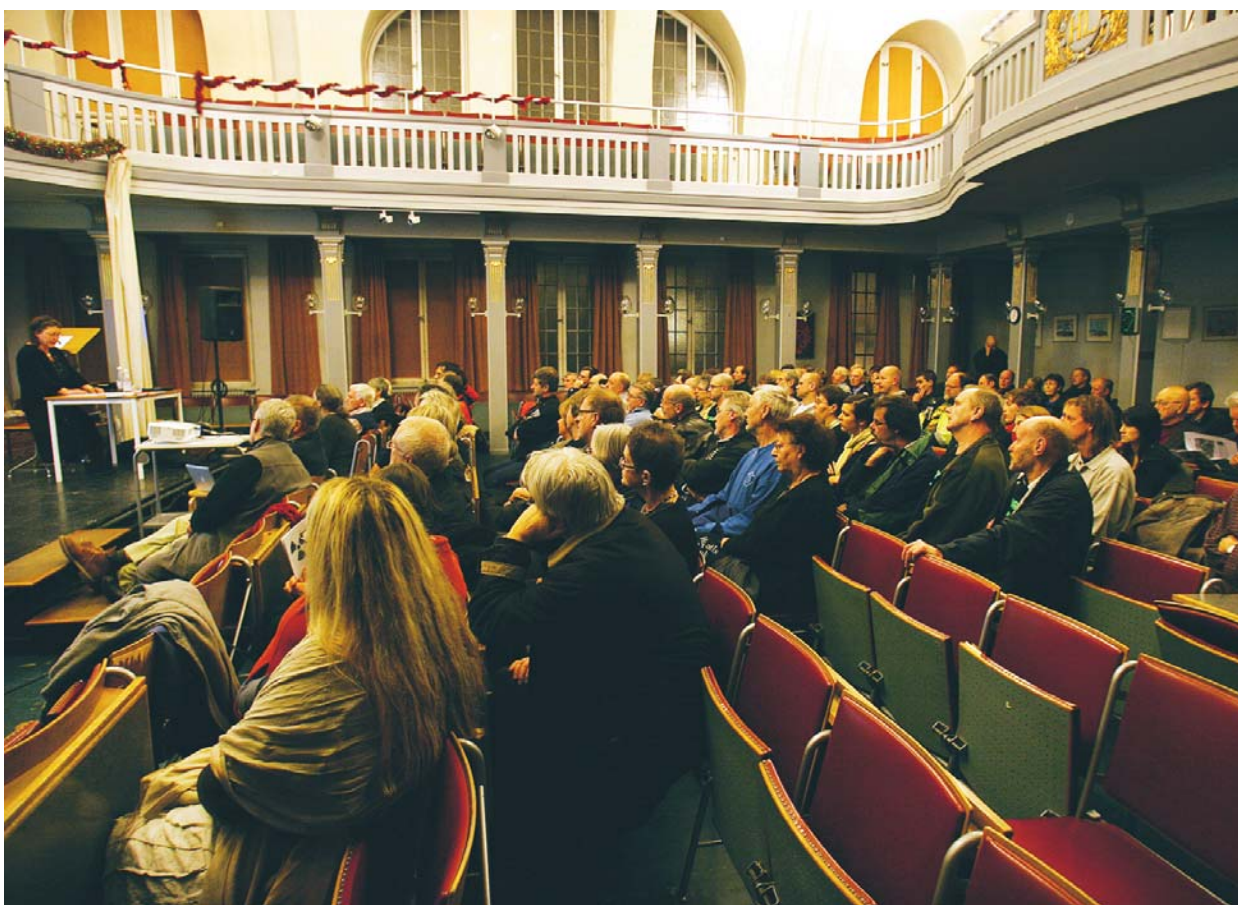
Läroverkets aula var välfylld vid gårdagkvällens opinionsmöte.